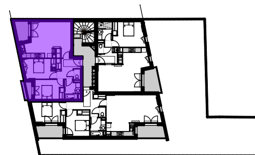
Plan d'ensemble - Etage 1